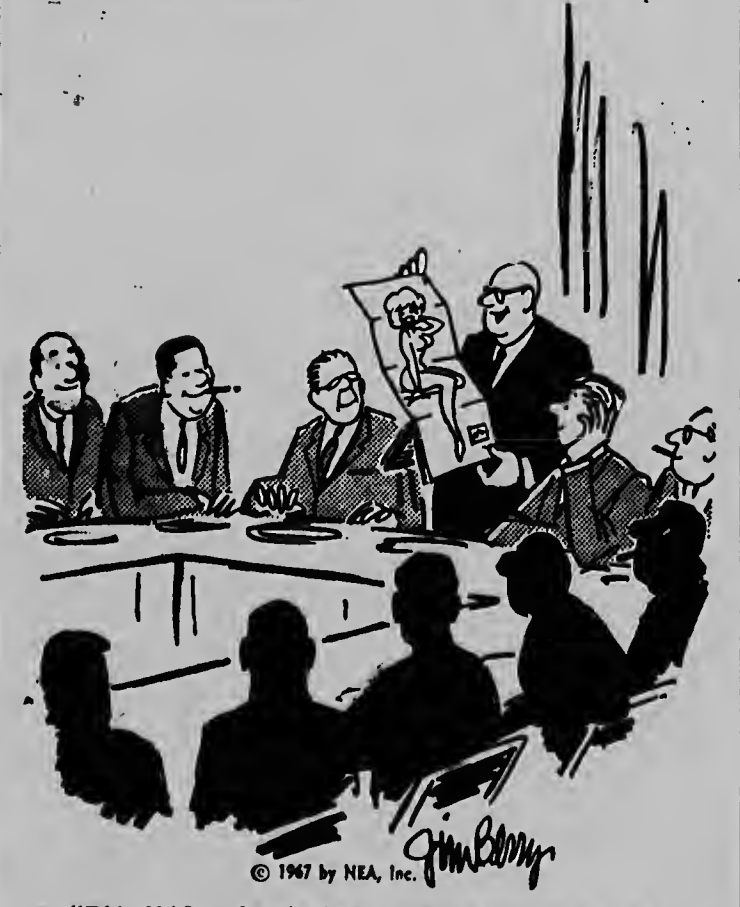
"This HAS to be the best annual report we've ever published!"